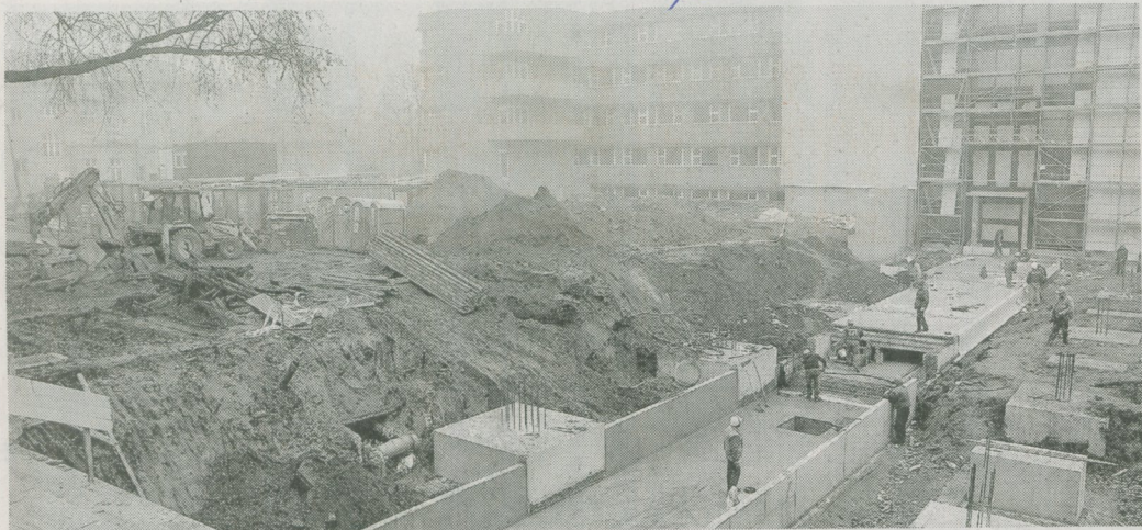
Madártávlatból – novemberre a mai munkaterületen új sürgősségi központ áll majd

TIOP-2.2.2-08/2-2010-0003 számú projektre elszámolásra beadva